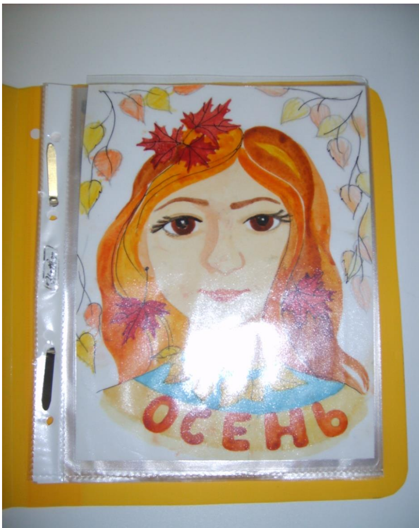
Книжка – малышка «ОСЕНЬ».